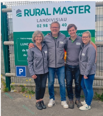
Rural Master Agri Services