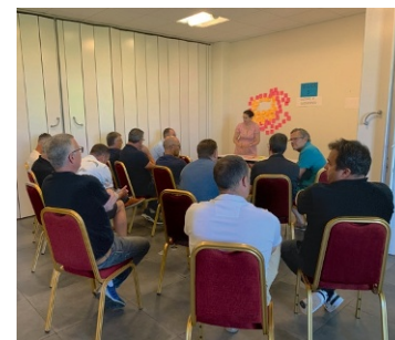
Moteurs & Réseaux

L'un des quatre ateliers du séminaire, ici sur le thème des cultures et de la biodiversité.